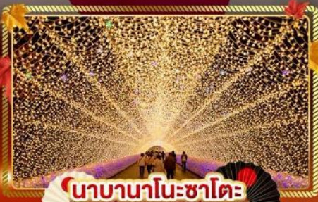
นาคานาโนะซาโตะ

"ชมความงามของฤดูใบไม้เปลี่ยนสี" เที่ยวครบจบทุกไฮไลท์ โอซาก้า-โตเกียว พิเศษ!! บินแอร์แบบ FULL SERVICE